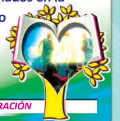
4to. MISTERIO LUMINOSO: LA TRANSFIGURACIÓN

9 Oramos por los pastores y miembros de la Iglesia para que sean transformados en la Escuela de Santidad de acuerdo a la invitación de Dios, "SEAN SANTOS COMO YO SOY SANTO".