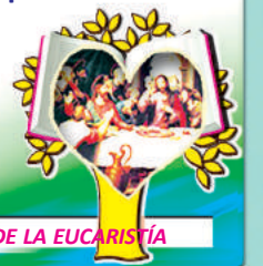
5to. MISTERIO LUMINOSO: LA INSTITUCIÓN DE LA EUCHARISTÍA

10 Oramos para que todas las comunidades cristianas tengan sacerdotes para proclamarles La Palabra de Dios y administrarles los sacramentos.