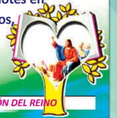
3er. MISTERIO LUMINOSO: LA PROCLAMACIÓN DEL REINO

8 Oramos por los Obispos para que instruyan bien y cooperen con los sacerdotes en establecer unidad entre obispos, sacerdotes y la comunidad.