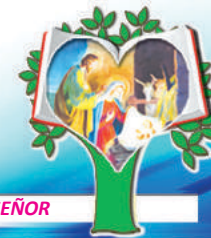
3er, MISTERIO GOZOSO: LA NATIVIDAD DEL SEÑOR

3 ORAMOS POR LOS CRISTIANOS PARA QUE RECIBAN RESPETO Y PROTECCIÓN DE LOS LIDERES CIVILES Y POLÍTICOS DEL PAÍS.