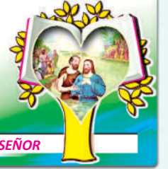
1er. MISTERIO LUMINOSO: EL BAUTISMO DEL SEÑOR

6 . Oramos por los medios de comunicación para que sean libres del descontrolado uso e influencias satánicas.