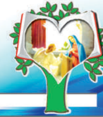
1er. MISTERIO GOZOSO: LA ANUNCIACIÓN

1 ORAMOS POR EL PAPA FRANCISCO Y LOS LIDERES DE LA IGLESIA PARA RENOVAR LA FAZ DE LA TIERRA CON PODER DEL ESPÍRITU SANTO