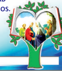
2do, MISTERIO GOZOSO: LA VISITACIÓN

2 ORAMOS POR TODOS LOS MIEMBROS DE LAS PARROQUIAS PARA QUE SE MANTENGAN COMO FUERTES PILARES DE LA COMUNIDAD CON ORACIONES Y BUENOS TRABAJOS.