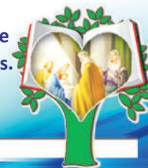
4to. MISTERIO GOZOSO: LA PRESENTACIÓN

4 Oramos por todos aquellos que están alejados de la comunidad cristiana y por todos los no creyentes para que puedan recibir la Palabra Salvadora de Dios y entren al Reino de Dios.