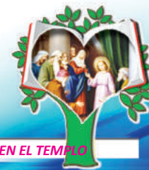
5to. MISTERIO GOZOSO: JESÚS ENCONTRADO EN EL TEMPLO

5 . Oramos por todos los lideres del mundo para que sean iluminados a entender el Cristianismo y protejan las iglesias.