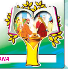
2do. MISTERIO LUMINOSO: LAS BODAS DE CANA

7 Oramos por todas las personas pobres y aisladas para que reciban amor, cuidados y abrigo